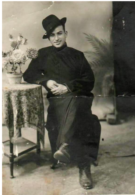
Фото на память о Японии, а в фотоателье нашлась ряса католического священника и «модная» довоенная шляпа. Вот, в этом одеянии, все солдаты и сфотографировались. Из-под рясы торчат кирзовые сапоги.

Домой прадед вернулся осенью 1945 года. Один из всех мужчин в семье. Мама, сестры, тёти надыхаться не могли на него. А он им... подмигивал. Ведь после контузии у него непроизвольно дергался глаз.